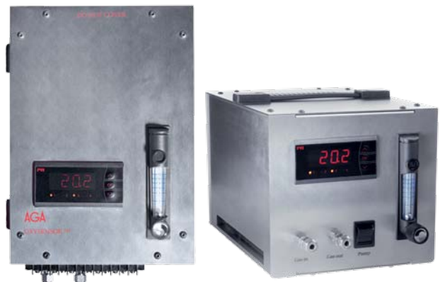
För väggmontage OXYSENSOR™, modell ISM, Portabel OXYSENSOR™, modell POA.