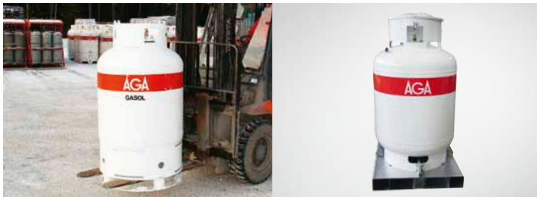
Maxiflaskan kan lätt lyftas med gaffeltruck.