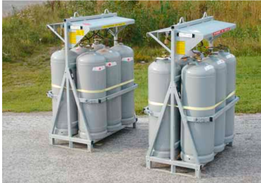
Flaskpaket finns i två versioner – för vätskefasuttag (till vänster) och för gasfasuttag (till höger).